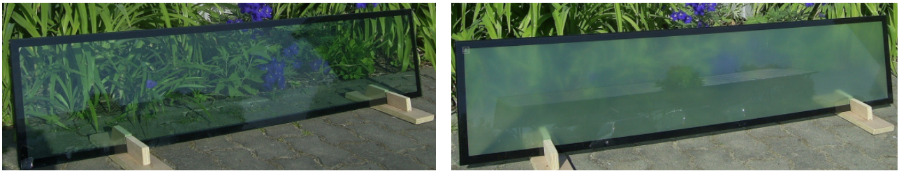
Bild 1: Selbstregulierende Sonnenschutzverglasung, links: 25 °C, rechts: 37 °C Oberflächentemperatur.

Die gleichmäßige Streuung führt überdies zu einer drastischen Reduktion von Blendeffekten, schädliche UV-Strahlen werden absorbiert.